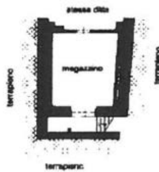
PIANO INTERRATO hm=1.85 m