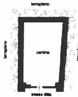
PIANO INTERRATO hm=1.85 m